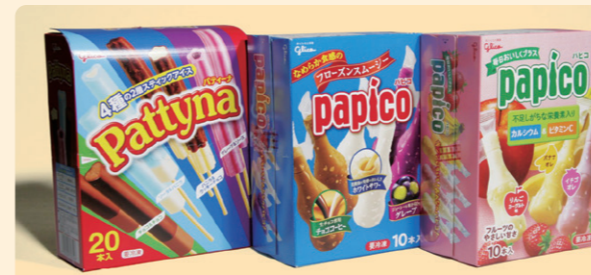
● パティーナ ● パピコマルチ

当工場では、パティーナ・パピコマルチに代表されるマルチタイプ製品専用ラインを備え、家族みんなで楽しめるファミリーパックアイスを製造しています。高精度な連続充填を可能にするバイターラインと、素材の風味を損なわず形成する急速冷凍ライン、なめらかな食感と均一な品質を実現しています。多本入り製品に求められる安定した重量管理・形状精度・食感の均一性を徹底し、幅広いニーズに対応。衛生管理基準に基づく厳格な品質検査を行い、安心してお召し上がりいただける製品づくりを追求しています。