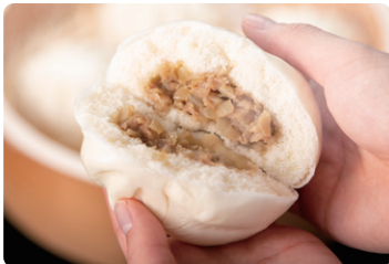
キャンディ屋さんの豚まん